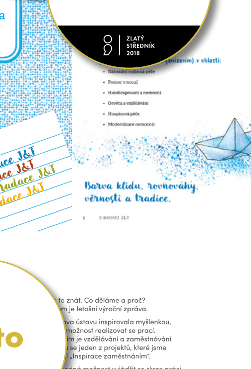
Ukázky Tereziny práce na reálných zakázkách.